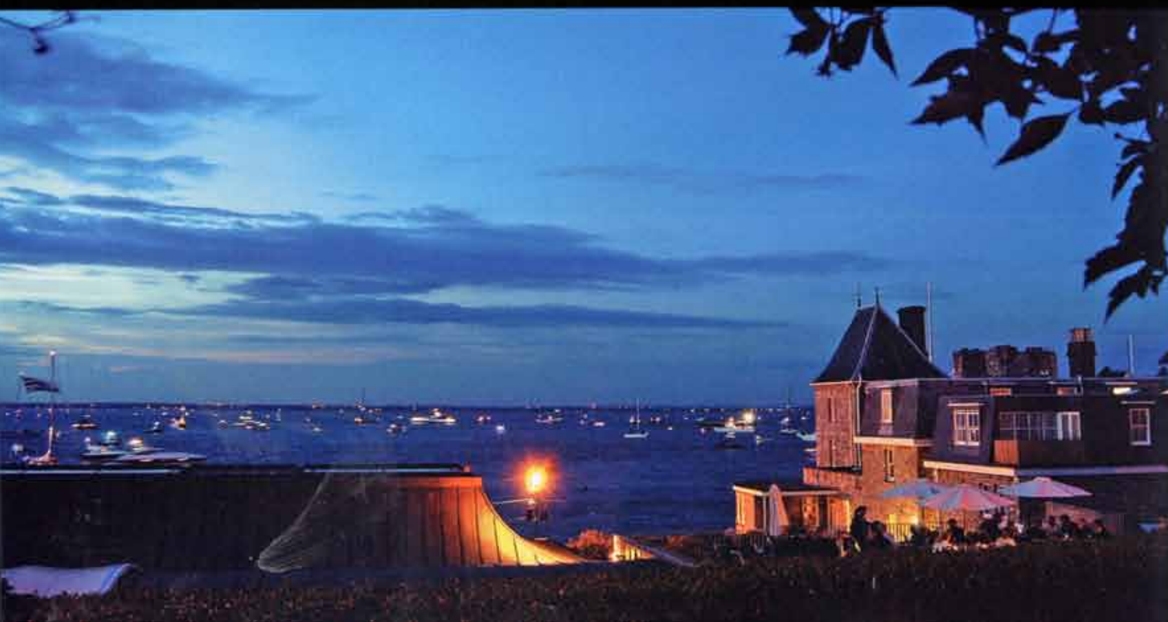
IEMAND MET ROYALE MIDDELEN EN BEWEZEN AFFINITEIT MET DE ZEILSPORT ZAL BLIJVEN STUITEN OP EEN ONVERBIDDELIJK 'NEE, U MOET EEN PROPOSER HEBBEN'

Links: De Hertog van Edinburgh oftewel prins Philip verlaat via de steiger van de RYS de club om terug te keren naar Patricia, die van de regering is geleend. De Windsors hebben momenteel geen koninklijk jacht meer