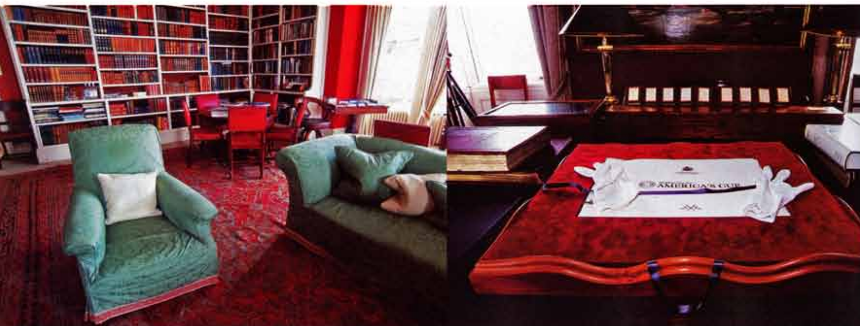
NIEUWE LEDEN DIE DE DREMPEL VAN DE SQUADRON OVER MOGEN, ZIJN EERDER BEJAARDE BEHEERDERS VAN FAMILIEVERMOGENS DAN JONGE, SNELLE ONDERNEMERS

Onder: Een blik in de rustieke bibliotheek. Op tafel een box met foto's van Beken of Cowes. Handschoenen aant!